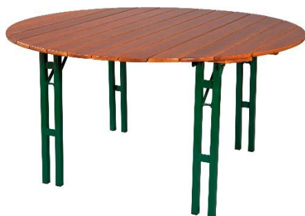
Tisch 150 cm rund