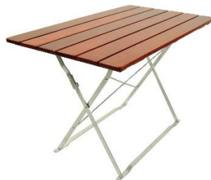
Tisch 120x70 oder 120x80