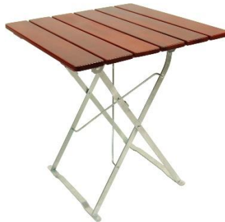
Tisch 70x70 oder 80x80