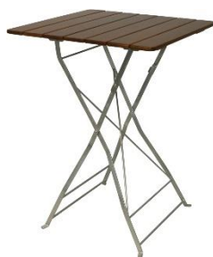
Stehtisch 80x80 cm