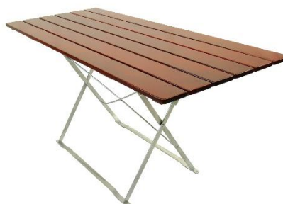
Tisch 160x70 oder 160x80