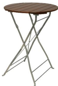
Tisch 80 cm rund