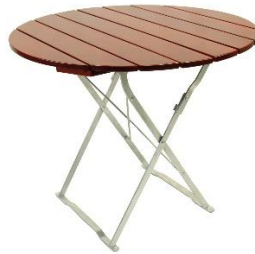
Tisch 70 cm, 80 cm oder 90cm rund