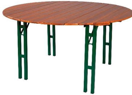
Tisch 150 cm rund