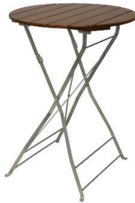
Tisch 80 cm rund