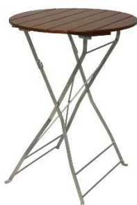
Tisch 80 cm rund