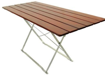
Tisch 160x70 oder 160x80