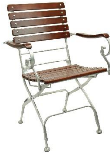
Bad Tölz Sessel