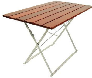
Tisch 120x70 oder 120x80