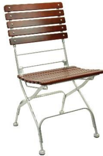
Bad Tölz Stuhl