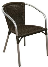
San Remo KN-5219