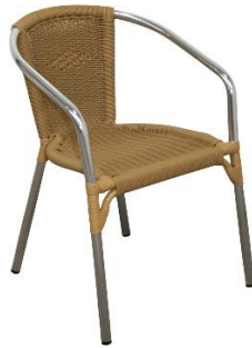
San Remo KN-5203