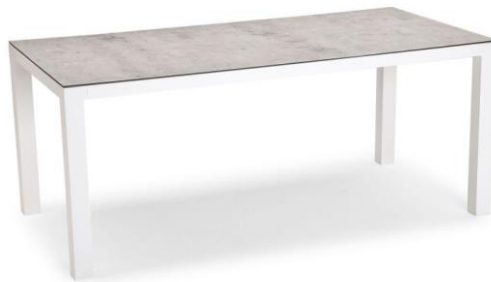
Tisch Houston 160x90 cm