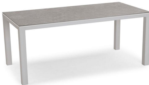
Tisch Firenze 210x90 cm