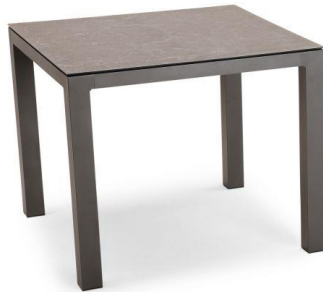
Tisch Houston 90x90 cm