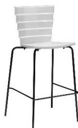
Barhocker Bikini ME.349