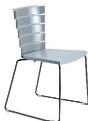
Stuhl Bikini ME.531