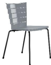
Stuhl Bikini ME.530