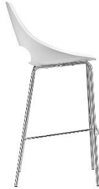
Barstuhl Echo ME.332