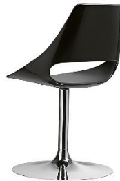
Stuhl mit Standfuss Echo ME.153