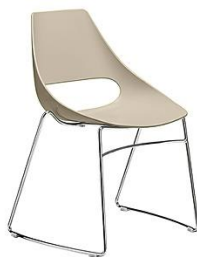
Stapelstuhl mit Kufengestell Echo ME.152