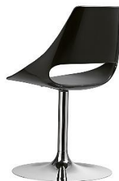
Stuhl mit Standfuss Echo ME.153