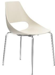
Stapelstuhl Echo ME.150