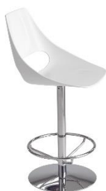
Barstuhl Säulengestell Midi Echo ME.333B