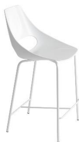
Barstuhl Midi Echo ME.332B