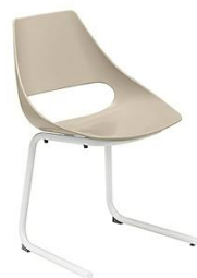
Stuhl mit Freischwinger Echo ME.156