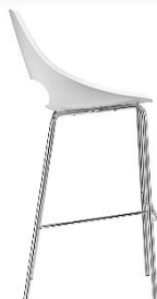
Barstuhl Echo ME.332