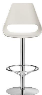
Barstuhl Säulensestell Echo ME.333