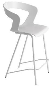
Barhocker MIDI IBIS ME.302B