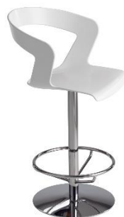
Barhocker Einsäulig MIDI IBIS ME.303B