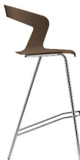
Barhocker 4-Fuss ME.302