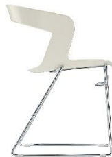
Stapelstuhl mit Kufengestell IBIS ME.160