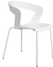
Stapelstuhl IBIS ME.002