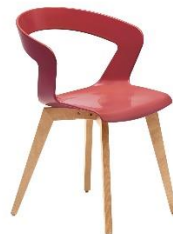
Stuhl mit Holzgestell IBIS ME.139