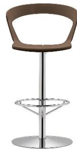
Barhocker Einsäulig IBIS ME.303