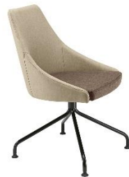
Sessel mit 4-Fuß Spinnengestell Kontea ME.588