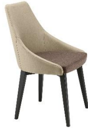
Sessel mit Holzgestell Kontea ME.590