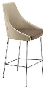
Barhocker Kontea ME.307