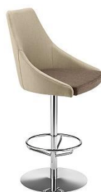
Barhocker Säulengestell Kontea ME.310