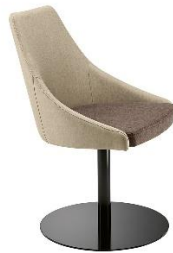
Sessel mit Säulenengestell KICCA ME.587