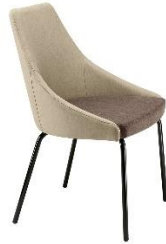
Sessel 4-Fuß Gestell KICCA ME.586