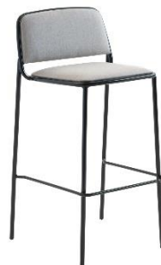
Barhocker Ring ME.672