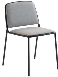
Stuhl Ring ME.670