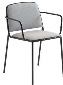
Stuhl mit Armlehnen Ring ME.671