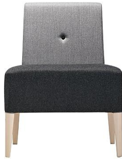
Mittelteil PUNTO ME.227