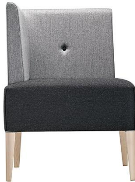
Eckteil PUNTO ME.228