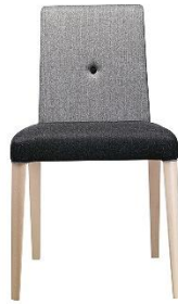
Stapelstuhl Nassau ME.533