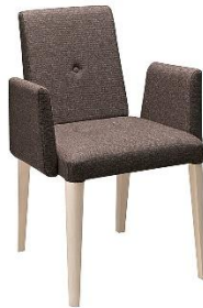
Stapelstuhl mit Armlehnen Nassau ME.534