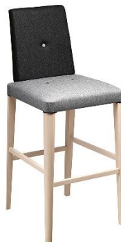
Barhocker Nassau ME.537