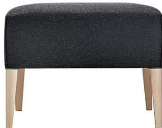
Hocker PUNTO ME.229